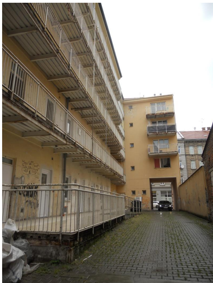
POHLED ZE DVORNÍ ČÁSTI