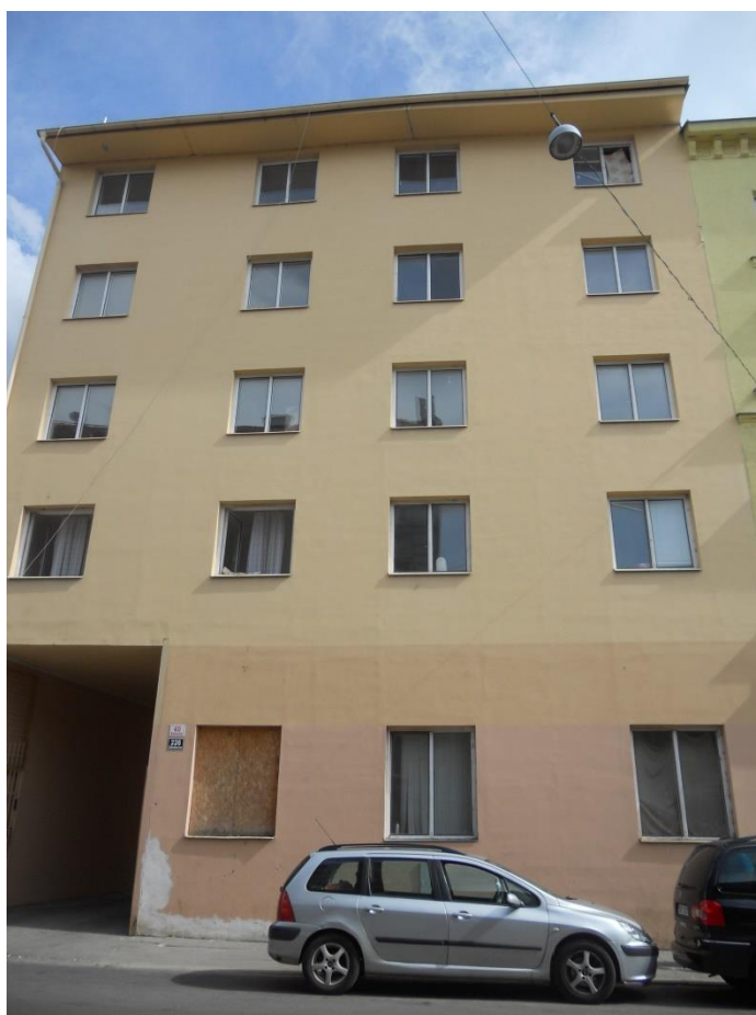
POHLED Z ULICE BRATISLAVSKÁ