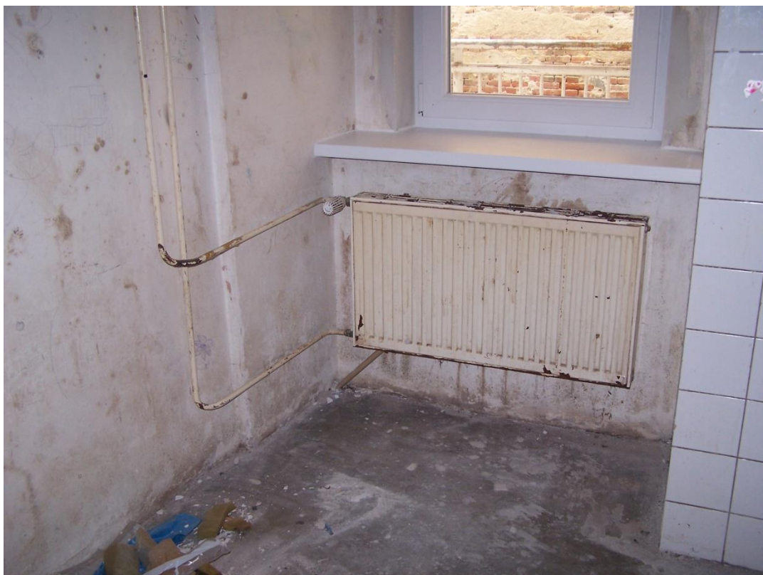
PODLAHA V KUCHYNI